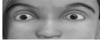
Grandeur des pupilles inégale