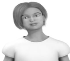
Inclinaison de la tête